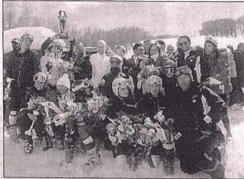
La grande famille du ski était réunie dimanche à Auron.

La piste du Colombier a offert en cette journée ensoleillée, une belle neige, comme le soulignait Mme